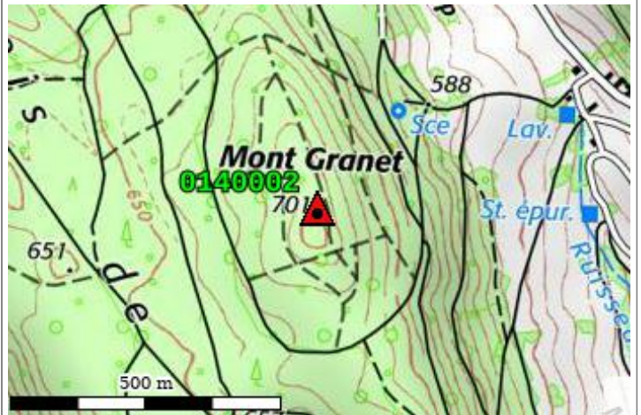
Carte : 3231 BELLEY