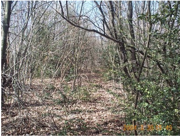
Azimut de la prise de vue : 390 gr