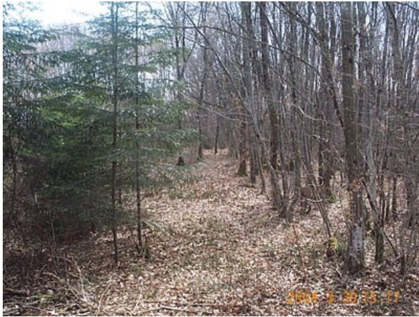
Azimut de la prise de vue : 210 gr

No du Site 0140001 Site du Réseau de détail